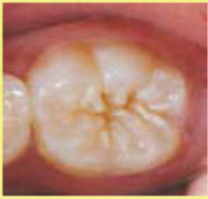
DIENTE NO SELLADO